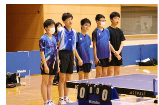
【卓球の合同チーム】