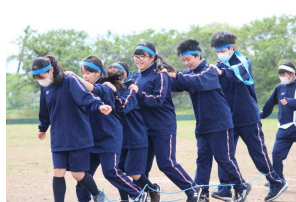
プログラム「増殖」より三人四脚とムカデ競争