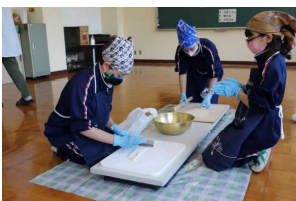
プロジェクトアドベンチャー